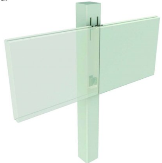
Detalle de pilar con panel colgado con guía de sujeción

Los pilares también pueden ir provistos de encajes en cada una de sus caras para recibir paneles prefabricados de diferentes espesores.