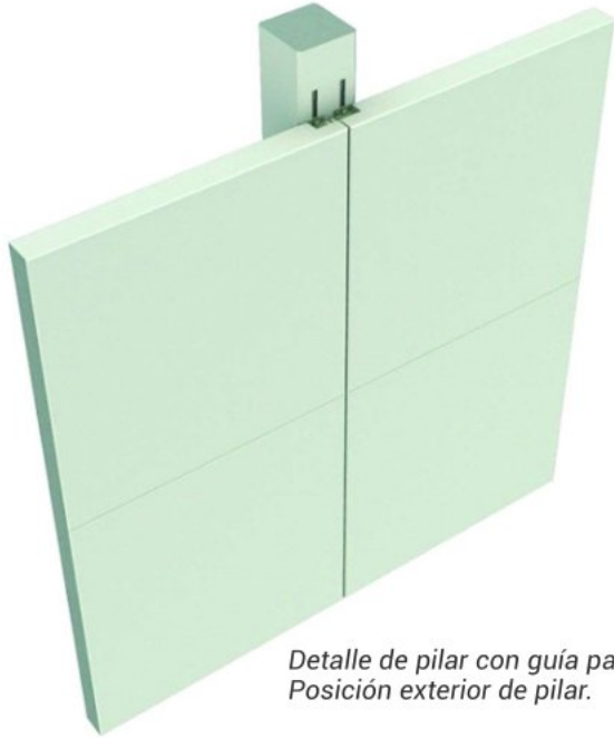
Detalle de pilar con guía para sujeción de panel. Posición exterior de pilar.