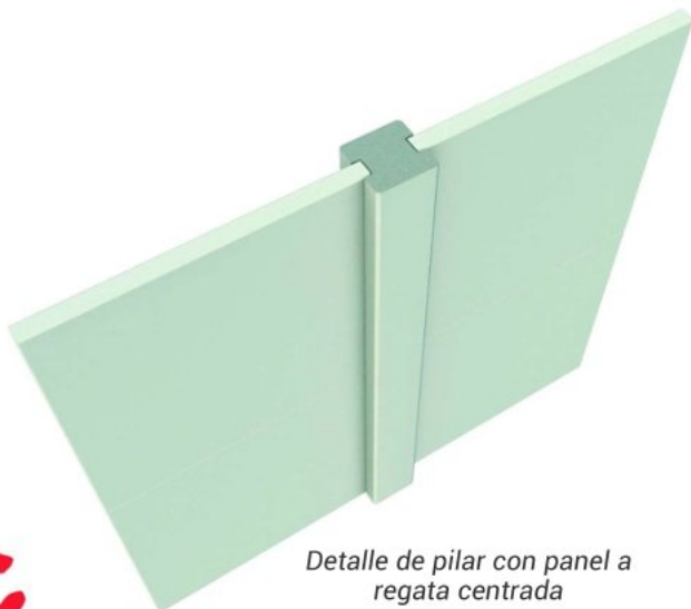
Detalle de pilar con panel a regata centrada

Elementos estructurales fabricados en distintas geometrías y secciones, incluida la redonda, con posibilidad de incorporarle ménsulas para forjados y puentes grúa, así como todos los herrajes necesarios para su correcta ejecución en obra.